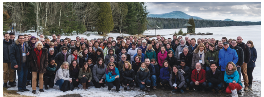
Participants du Symposium annuel du GRIL tenu en mars dernier au Centre de villégiature Jouvence à Orford (QC).