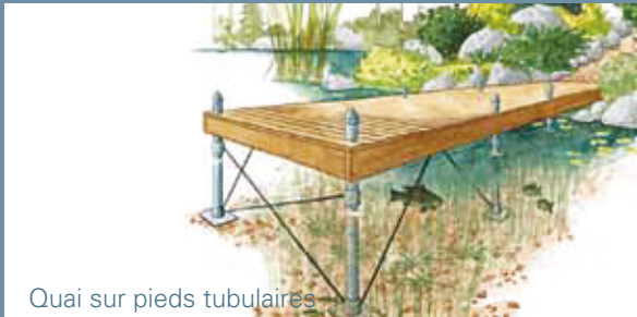
Quai sur pieds tubulaires