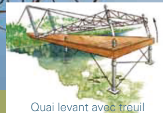
Quai levant avec treuil