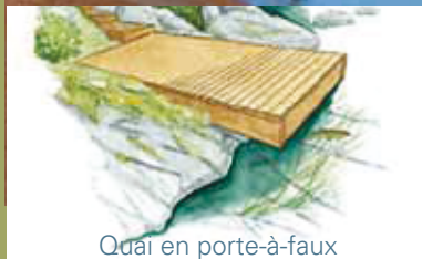
Quai en porte-à-faux