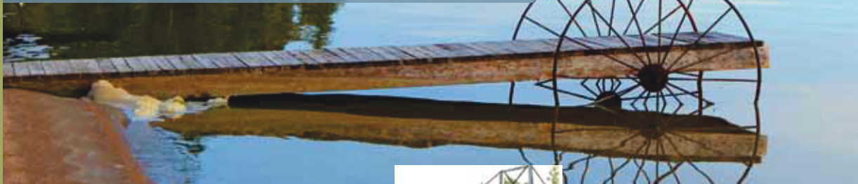
Quai sur roues