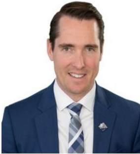
Monsieur Simon Allaire Député de Maskinongé

Quelle belle initiative de la Table de concertation régionale du lac Saint-Pierre de créer une occasion d'échanger entre les différents acteurs du milieu pour la protection du lac Saint-Pierre.