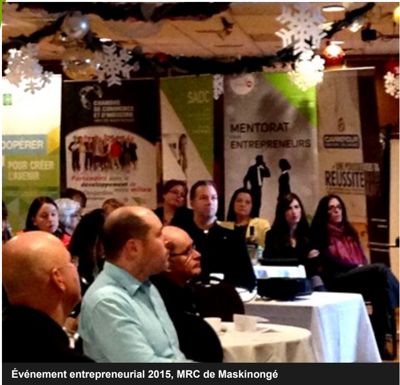
Événement entrepreneurial 2015, MRC de Maskinongé

Un des objectifs des événements / rencontres écoresponsables est de se rapprocher le plus possible du « zéro déchet », soit ne produire aucun déchet.