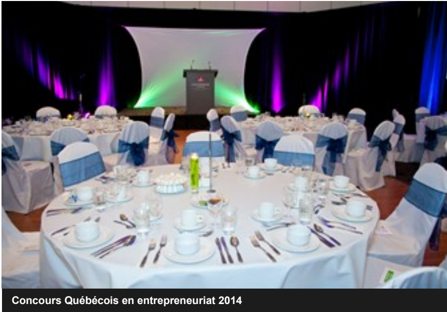
Concours Québécois en entrepreneuriat 2014