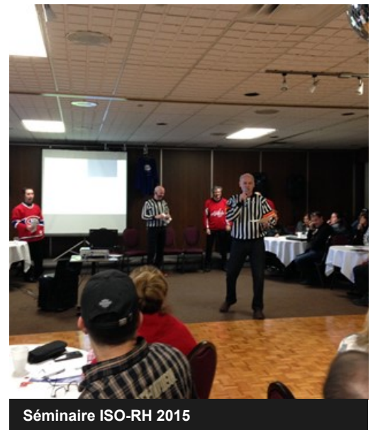
Séminaire ISO-RH 2015