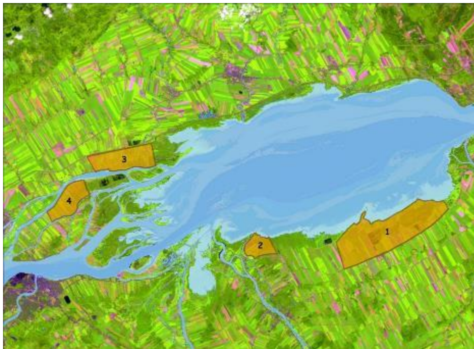
Figure 1. Localisation des secteurs d'échantillonnage prioritaires du Pôle pour les activités de recherche des axes agriculture et environnement et faune. Secteurs de 1) Baie-du-Febvre, 2) Pierreville, 3) Saint-Barthélemy et 4) l'île Dupas.