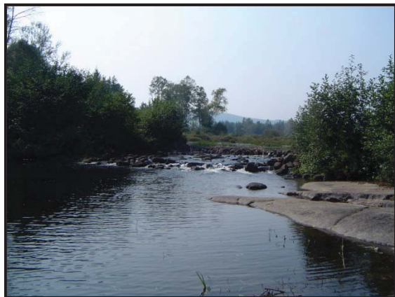
Rivière aux écorces dans le secteur amont du bassin versant de la rivière du Loup.

Les communautés de diatomées que l'on retrouve dans les cours d'eau en milieu naturel sont composées d'espèces non tolérantes aux perturbations; espèces oligotrophes, présentes en eaux pauvres en nutriments (IDEC = classe A).