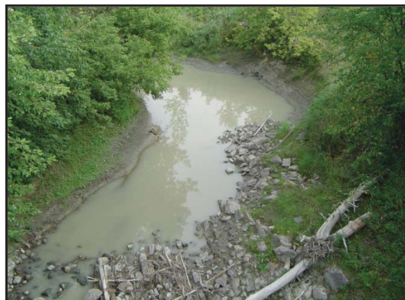
Embouchure de la rivière Chacoura dans le secteur aval du bassin versant de la rivière du Loup.

Par contre, dans les cours d'eau subissant des perturbations, particulièrement où les nutriments sont en excès, nous retrouvons des espèces tolérantes aux perturbations; espèces hypereutrophes (IDEC = classe E).