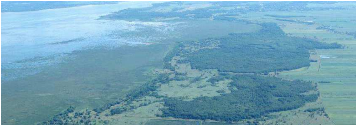
Vue aeriene du refuge d'oiseaux migrateurs de Nicolet.

Importance du refuge d'oiseaux migrateurs | Acces et activites | Carte du refuge | Tableau sommaire | Coordonnees